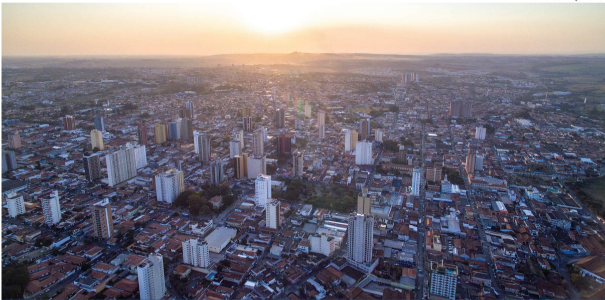
Limeira conta com grandes empresas líderes que auxiliam no crescimento econômico e social da cidade e comunidade