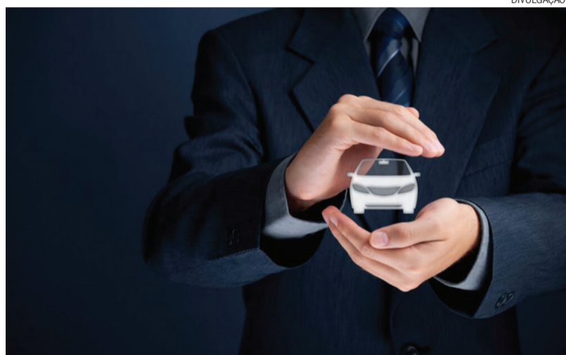
Além do custo-benefício, o seguro de frota permite a cobertura de qualquer condutor e de alguns serviços emergenciais

Ter um seguro veicular deixou de ser um conforto, e hoje tornou-se uma necessidade. Ele garante tranquilidade ao condutor sobre eventuais acidentes, rou-