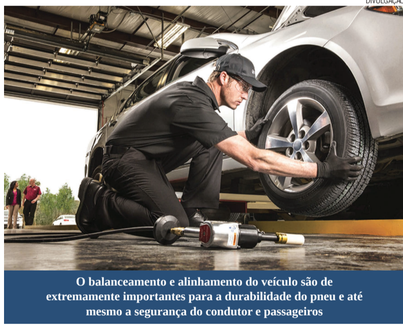
O balanceamento e alinhamento do veículo são de extremamente importantes para a durabilidade do pneu e até mesmo a segurança do condutor e passageiros

Por fim, o pneu deve ter seu tempo de vida e durabilidade respeitados. Por isso nunca é aconselhável recapar, recauchutar ou até mesmo remoldar pneus de veículos (por ser considerado um item de segurança, algumas seguradoras podem negar atendimento a sinistros que possuam uma destas alterações em seus pneus), principalmente os de passeio, além de se optar sempre por profissionais qualificados e de confiança.